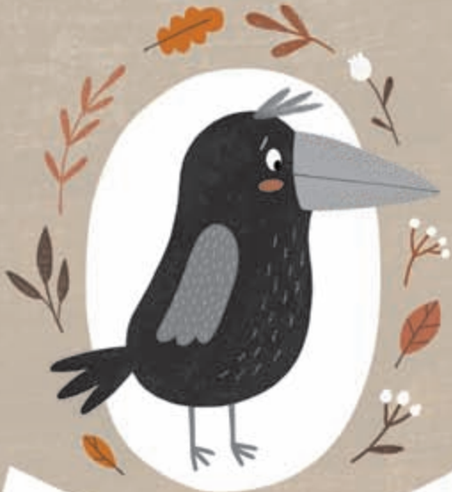
ΚΕΡΑΣΑΚΗΣ ΚΟΡΑΚΗΣ (4 χρονών)

Του αρέσει: να ονειροπολεί στον ουρανό με τα μάτια κλειστά. Δεν του αρέζουν: τα άχουρα κεράγια. Έδωσε ένα φτερό του στον συγγραφέα αυτού του βιβλίου, που μετά το χρησιμοποίησε για να γράψει αυτή την ιστορία.