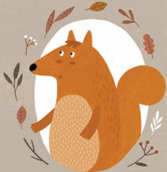
ΦΟΥΝ ΟΥΚΑΚΗΣ ΣΚΙΟΥΡΑΚΗΣ (σε λίγες βελίδες 5 χρονών)

Του αρέσει: να ονειροπολεί στον ουρανό με τα μάτια κλειστά. Δεν του αρέζουν: τα άχουρα κεράγια. Έδωσε ένα φτερό του στον συγγραφέα αυτού του βιβλίου, που μετά το χρησιμοποίησε για να γράψει αυτή την ιστορία.