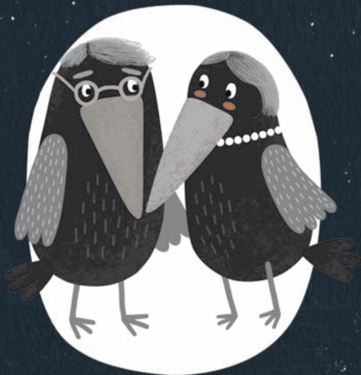
ΜΑΜΑ ΚΑΙ ΜΙΤΑΜΠΤΑΣ ΚΟΡΑΚΗ

Φοβούνται ότι κάτι μπορεί να συμβεί στον Κεραβάκη. Πετάνε παντού μαζί του και τον αφήνουν να πάει μόνος του μονάχα ως το πιο κοντινό πεύκο. Του φουβάνε τη βούπα πριν του τη δώσουν, για να μην κάψει το ράμφος του. Αυτά όμως δεν βοηθάνε τον Κεραβάκη, γιατί πρέπει να μάθει να φροντίζει τον εαυτό του.