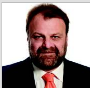
ΔΗΜΗΤΡΗΣ ΚΑΡΝΑΒΟΣ Δήμαρχος Καλλιθέας

Φέτος στις Απόκριες, αλλάζουμε ρότα στην Καλλιθέα, εμπλουτίζοντας το πρόγραμμά μας με τέσσερις νέους θεσμούς, που τους είχε ανάγκη η πόλη: Μεγάλη παρέλαση μεταμφιεσμένων, Τσικνοπέμπτη με μεζέδες και ζωντανή μουσική, πάρτι για μικρούς και μεγάλους σε κλειστό γυμναστήριο καθώς και διαγωνισμό αποκριάτικης στολής. Από κοντά τα Μπουλούκια, καντάδες στις γειτονιές, παιδικός-νεανικός κινηματογράφος, θέατρο για όλους, μουσικοχορευτικές παραστάσεις και ξεχωριστή συναυλία με πατροπαράδοτα εδέσματα στο πέταγμα του καρταετού. Κάθε μέρα εκδηλώσεις από την έναρξη του Τριωδίου ως την Καθαρή Δευτέρα!